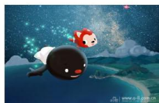
人民网2月13日电(记者 朱传戈)2014... 人民网2月13日电(记者 朱传戈)2014年2月17日元宵节过后,阿狸携北京梦之城团队送出开年大礼——全新励志...[详细]