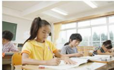
2016年寒假数学组教师美