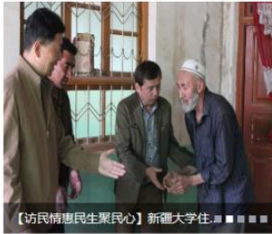
【访民情惠民生聚民心】新疆大学住...