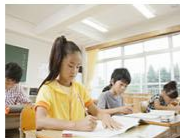
2016年寒假数学组教师美