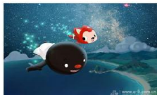
人民网2月13日电(记者 朱传戈... 人民网2月13日电(记者 朱传戈)2014年2月17日元宵节过后,阿狸携北京梦之城团队送出开年大礼——全新励志...[详细]