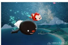
人民网2月13日电(记者 朱传戈)2014... 人民网2月13日电(记者 朱传戈)2014年2月17日元宵节过后,阿狸携北京梦之城团队送出开年大礼——全新励志...[详细]