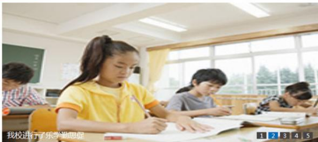
我校进行了乐学勤思促