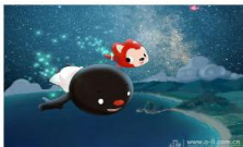
人民网2月13日电(记者 朱传戈... 人民网2月13日电(记者 朱传戈)2014年2月17日元宵节过后,阿狸携北京梦之城团队送出开年大礼——全新励志...[详细]