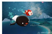
人民网2月13日电(记者 朱传戈)2014... 人民网2月13日电(记者 朱传戈)2014年2月17日元宵节过后,阿狸携北京梦之城团队送出开年大礼——全新励志...[详细]