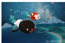
人民网2月13日电(记者 朱传戈)2014... 人民网2月13日电(记者 朱传戈)2014年2月17日元宵节过后,阿狸携北京梦之城团队送出开年大礼——全新励志...[详细]