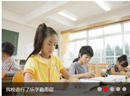
我校进行了乐学勤思促

4月18日上午,我们学校迎来了一批特殊的“小客人”——华中师范大学厦门海沧附属小学的8位同学,他们作为本校的优秀学生代表,前来我们学校参观学习...[详细]