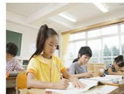
我校与外校举行了实验课程