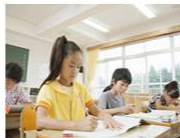
学为中心, 动态融合——区