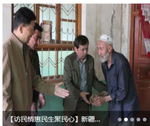
【访民情惠民生聚民心】新疆...